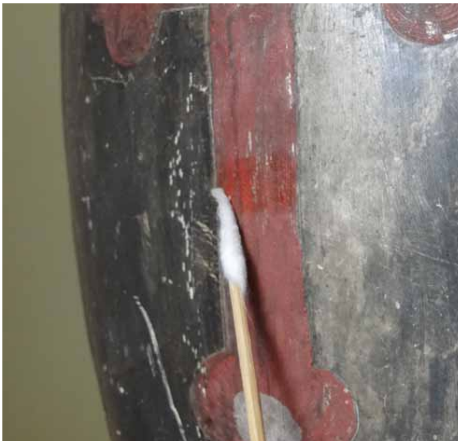
Détails des carnations avant et après retouche.

Isolation de l'argenture pour prévenir d'une nouvelle oxydation.