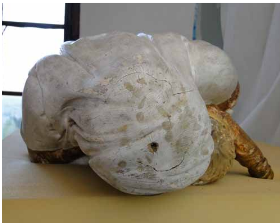
Détail de la sculpture après intervention de nettoyage et avant retouche.

Bien que cela n'ait pas été prévu initialement, les zones de la dorure et du socle trop lacunaires ont été retouchés. Des pigments libres mélangés au vernis ont été utilisés.