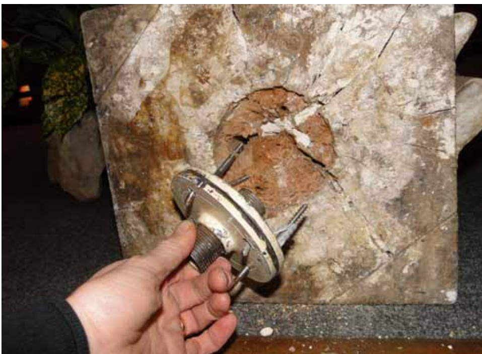
Détails de la sculpture et du socle avant intervention de nettoyage et de retouche.

Consolidation des pourtours des zones lacunaires et des soulèvements de la préparation