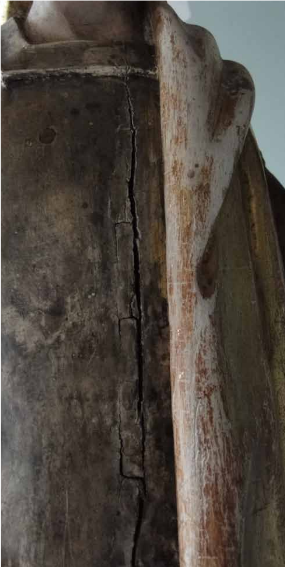
Vues de détails des altérations de la sculpture, dessus, sous le pied et les carnations.