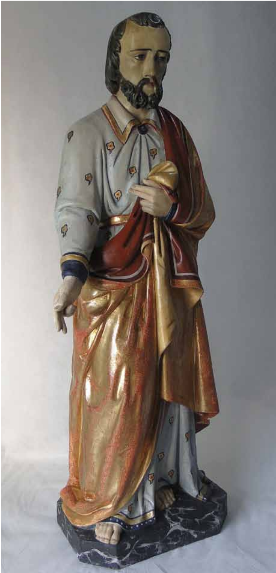
St Joseph après restauration.