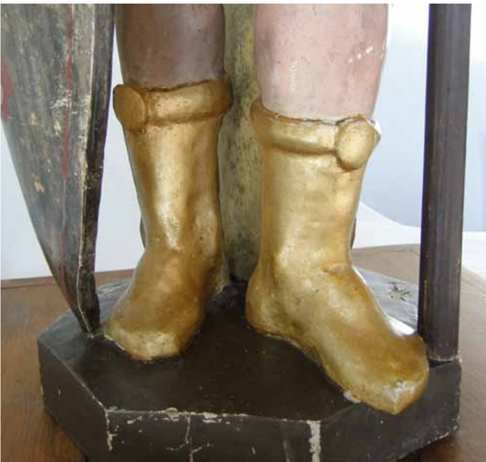
Détails des carnations avant et après retouche.